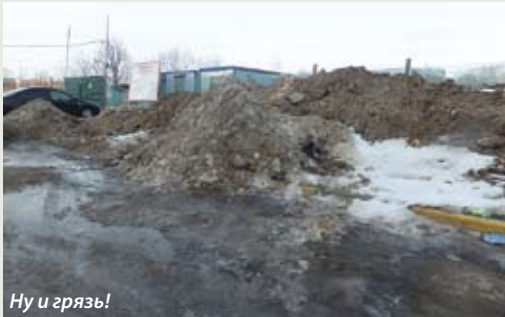
Ну и грязь!

Сотрудниками территориального отдела № 35 Госадмтехнадзора Московской области в рамках ежедневной надзорной деятельности уделяется особое внимание состоянию и содержанию строительных площадок: состоянию ограждения, прилегающей территории и подъездных путей.