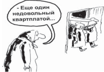
Рис. В. Богорада

Наряду с продовольствием серьезно подорожали услуги ЖКХ. Только за этот год в среднем на 19,1% выросла оплата жилья, на 12,6% — коммунальные платежи, на 10% больше приходится платить за телефон, на 7,7% — за проезд в метро, на 4,2% — в автобусах и троллейбусах. На 8,2% стало дороже постричься в парикмахерской, а на 4,4% — почистить одежду в химчистке. Топливо на