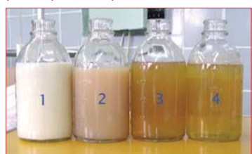
Плазма пациента с 1-й по 4-ю процедуру мембранного плазмафереза. Налицо отличия.

Оздоровление и профилактика. Сердечно-сосудистые болезни: атеросклероз, гипертоническая болезнь,