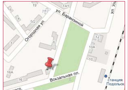
СХЕМА РАСПОЛОЖЕНИЯ ОТДЕЛЕНИЯ «ПОДОЛЬСКОЕ»

Справочная служба Банка: 8-800-100-4-888. Сайт www.mkb.ru