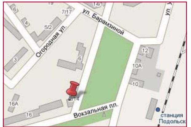
Схема расположения отделения «Подольское»