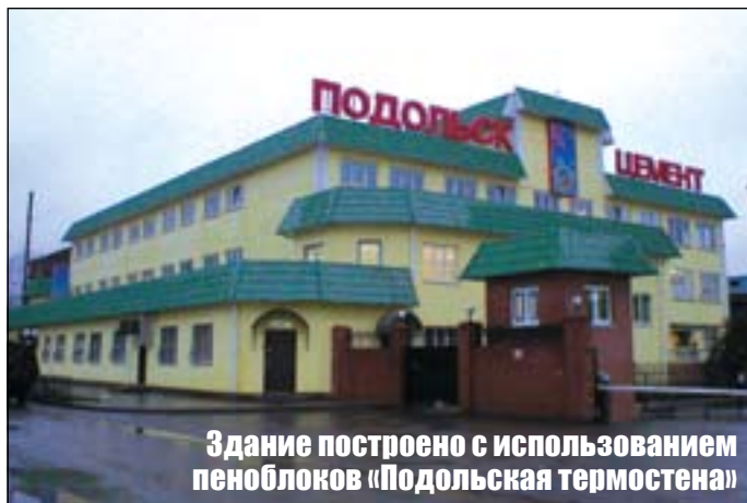
Здание построено с использованием пеноблоков «Подольская термостена»

Есть 5 веских причин, по которым дом сегодня нужно строить из пеноблоков. Нет, не из тех пеноблоков, которые мы видим на строительных рынках и состав которых нам зачастую не известен, да и вполне возможно, что привезены они в наш регион из Белоруссии или других соседних с ней регионов, которые в свое время весьма активно накрыла радиационная волна Чернобыля. Строить нужно из наших пеноблоков, местных, имеющих даже собственное имя — «Подольская термостена». Это название ОАО «Подольск-Цемент» присвоил своим новым строительным блокам, к выпуску которых коллектив цемзавода приступил еще два года назад. Но то были небольшие пробные партии, которые за короткий срок оказались очень востребованы потребителями. Сегодня завод выпускает ежедневно около 100 кубов пеноблоков «Подольская термостена».