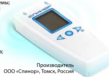
Производитель ООО «Спинор», Томск, Россия

ИМЕЮТСЯ ПРОТИВОПОКАЗАНИЯ. ПРОКОНСУЛЬТИРУЙТЕСЬ СО СПЕЦИАЛИСТОМ