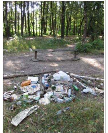
но скрылись под водой...

А уж отдыхать мы умеем! На берега Пахры почти вплотную к воде подъезжают на автомобилях; по лесным тропинкам, где гуляют люди с детьми, с бешеной скоростью носятся квадроциклы, а после «посиделок» весёлых компаний на природе остаётся столько мусора... Впрочем, лучше один раз увидеть, чем сто раз услышать. Берега Пахры загажены до такой степени, что издают зловонный запах, да и сама река стала похожа на тухлый пруд, заросший рыской. Над тропинками нависают сухие останки деревьев, поваленных бурей. Некогда великолепный липовый парк превращен в непроходимые дебри и свалку нечистот. Но, по-видимому, городским властям нет до этого никакого дела. Хотя, насколько мне помнится, ещё ранней весной из «Белого дома» раздавались обещания очистить дно реки от всякогохлама. Но, увы! Обещания так и остались обещаниями, и гнилые остовы машин, выброшенные отслужившие свой срок холодильники и прочие железяки благополучно