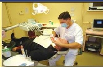
полное компьютерное обследование