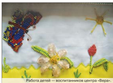
Работа детей — воспитанников центра «Вера».

Занятия с ребятами в центре «Вера» проводятся индивидуально. Детям помогают осваивать бытовые навыки и навыки самообслуживания. Специалисты готовят ребенка для поступления в детский сад, школу, а также развивают творческие способности. Здесь создана «креативная мастерская», где воспитанники занимаются вышиванием, шьют мягкие игрушки, создают куклы из пластика и другие поделки из бисера и соленого теста. А потом ребята с большим удовольстви-